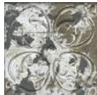
Aged Dark Ornato * 20x20 cm C-515